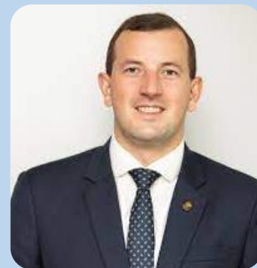
VIRGINIJUS SINKEVIČIUS, Komisarz do spraw środowiska, oceanów i rybołówstwa:

Przedsiębiorstwa będą również zobowiązane do gromadzenia dokładnych informacji geograficznych na temat gruntów rolnych, na których prowadzona jest uprawa towarów, które pozyskują, tak aby można było sprawdzić, czy towary wyprodukowano zgodnie z przepisami. Państwa członkowskie muszą zapewnić, by nieprzestrzeganie przepisów prowadziło do skutecznych i odstraszających kar.