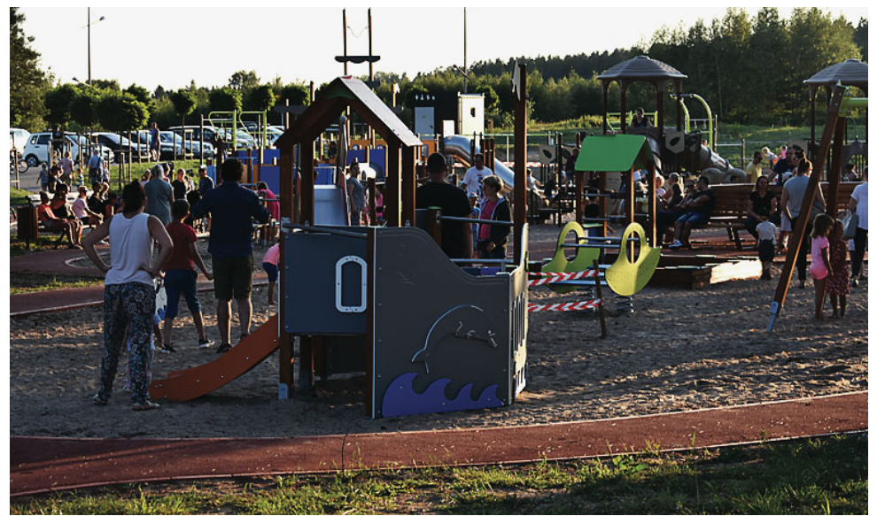
Plac zabaw przy Promenadzie Zdrojowej cieszy się ogromnym zainteresowaniem