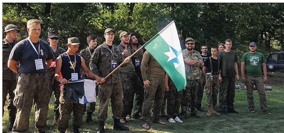
Zmagania drużyn trwały trzy dni

Na ponad 40 hektarach trudnego terenu, nad malowniczą rzeką i jeziorem Gołdap, przez trzy dni, „Siły Zbrojne Sojuza Wostocznego” i „Królestwa Westlandii” walczyły o zdobycie przewagi taktycznej