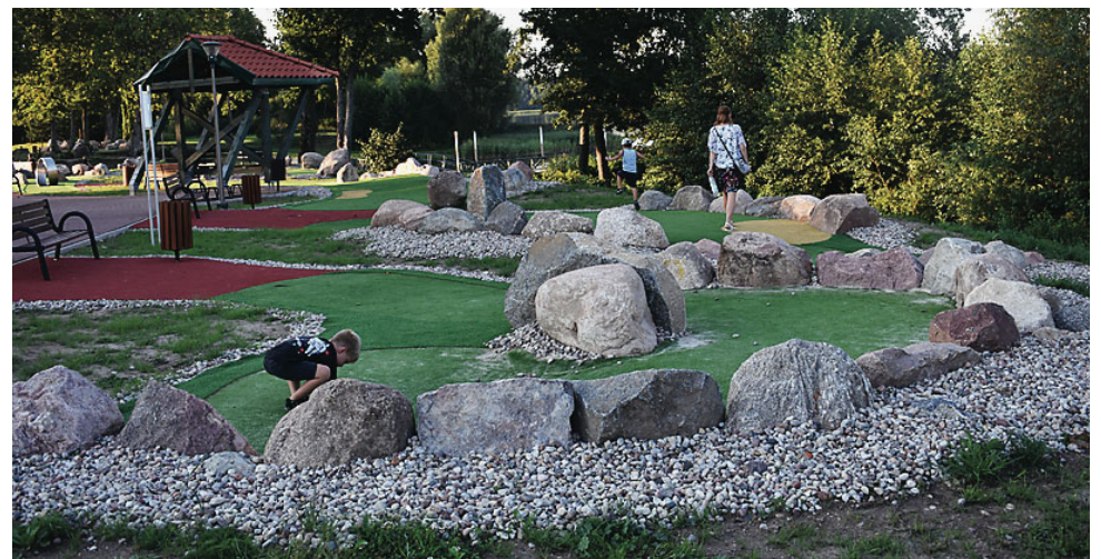
Nową atrakcją przy tężniach jest pole golfowe