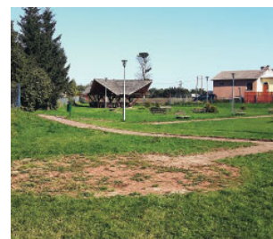
Siłownia zewnętrzna powstanie na terenie centrum kulturalno - rekreacyjnym w Galwieciach

- Powstałe w Galwieciach boiska zaspokajają potrzeby młodzieży, chcieliśmy nato-