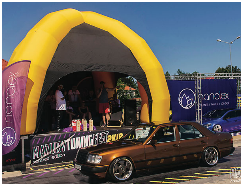
Druga edycja festiwalu „Mazury Tuning Fest” zgromadziła wielu miłośników tuningu i motoryzacji

4 i 5 sierpnia na Targowicy Miejskiej w Gołdapi odbyła się druga edycja festiwalu „Mazury Tuning Fest”, która zgromadziła miłośników tuningu i motoryzacji. Wjazd na główny plac imprezy miały auta po wcześniejszej selekcji przeprowadzonej przez organizatorów.auta, które przeszły ją pozytywnie mogły wziąć udział w 11 konkurencjach i zaważczyć o atrakcyjne nagrody. Edycja 2018 została zorganizowana przez grupę GoGołdap, 2speed.pl oraz niemieckiego producenta kosmetyków i chemii samochodowej - Nanolex.