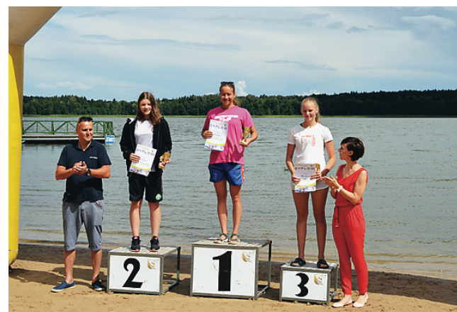
Najlepsi pływacy otrzymali pamiątkowe dyplomy i trofea sportowe