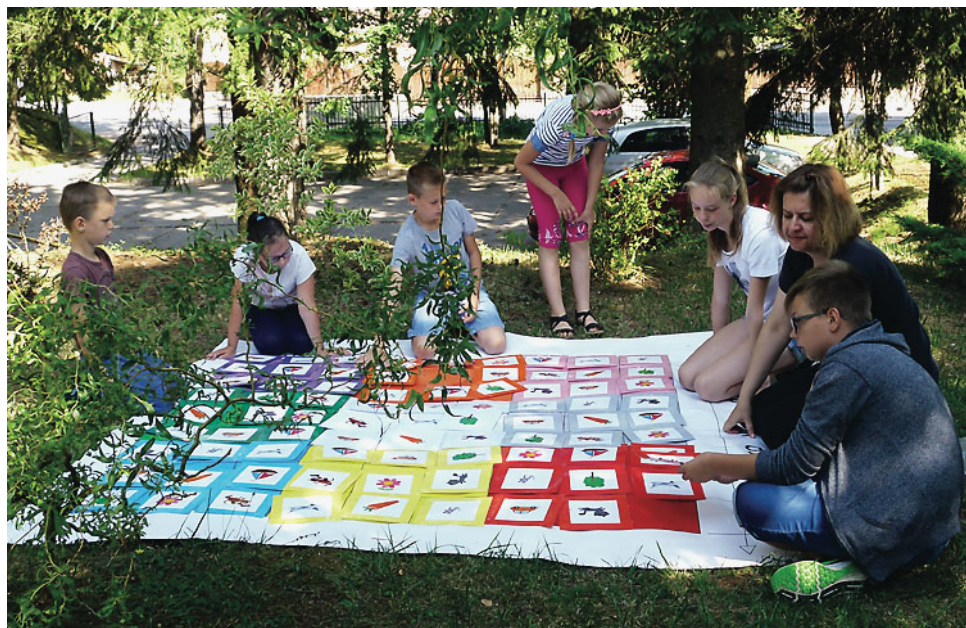
Wakacyjne zajęcia zostały przeprowadzone również w Filii w Grabowie