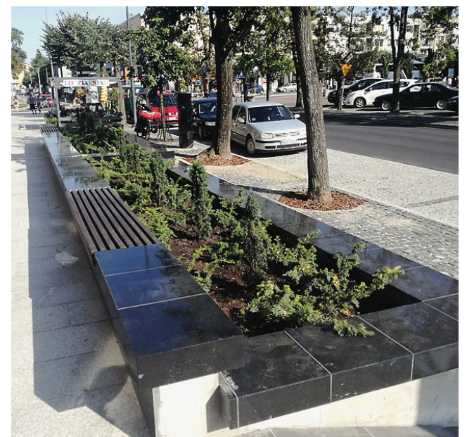
Stare kolby zostały zamienione na bardziej nowoczesne