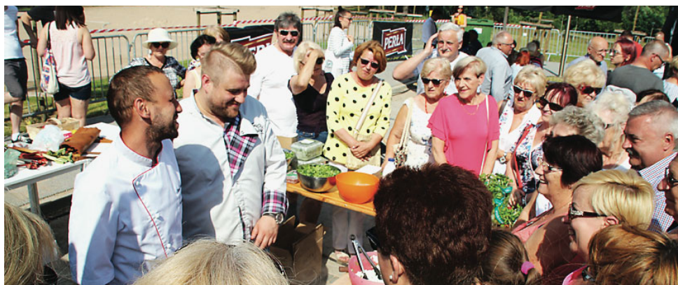
Podczas Festiwalu Zdrowia uczestnicy imprezy otrzymali cenne wskazówki na temat zdrowego odżywiania