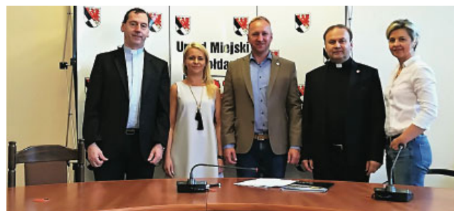
Umowy na przekazanie dotacji zostały podpisane w połowie lipca