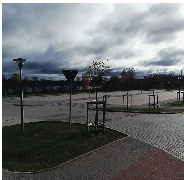
Nowy parking przy Promenadzie Zdrojowej