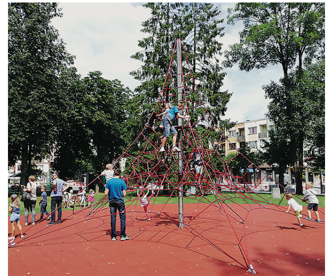
Linaarium w parku miejskim