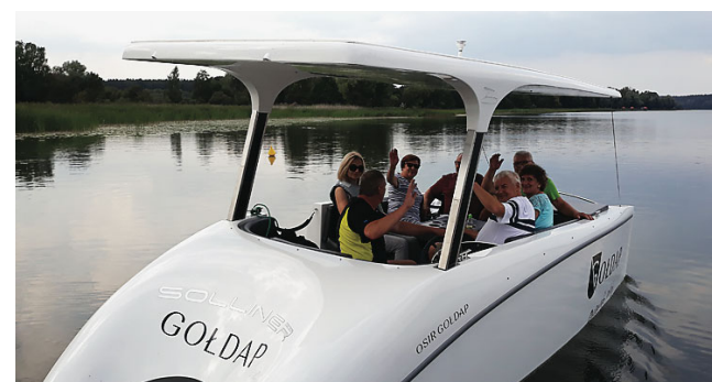
Katamaran jest nową atrakcją na jeziorze Gołdap

wanym nabrzeżu możliwe będzie uruchomienie szkółki żeglarskiej. Wypożyczalnia sprzętu pływającego wzbogaciła się dodatkowo o 10 łodzi wędkarskich, 15 kajaków, 10 rowerów wodnych oraz 10 desek do windsurfingu. Modernizacja obejmuje też sanitariaty, kuchnię polową i budynek wypożyczalni sprzętu pływającego. At