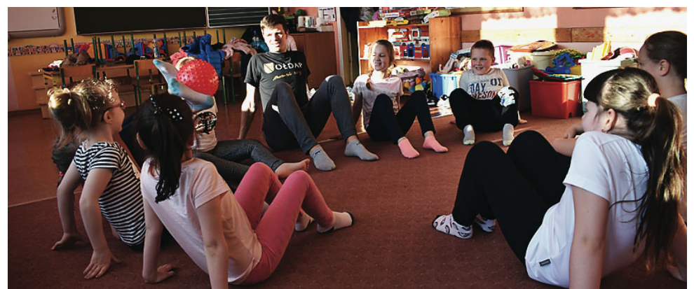
Od kwietnia do grudnia odbywają się zajęcia z gimnastyki korekcyjnej