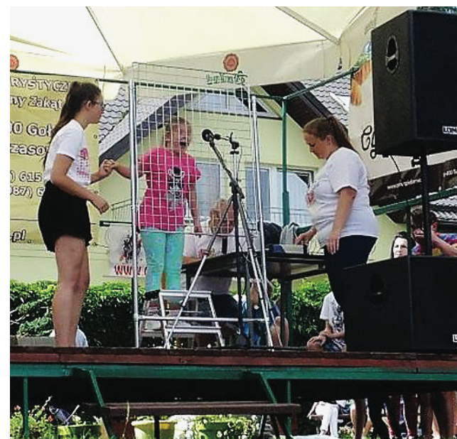
W Konkursie Krzyku udział mogą wziąć zarówno dzieci jak i dorośli