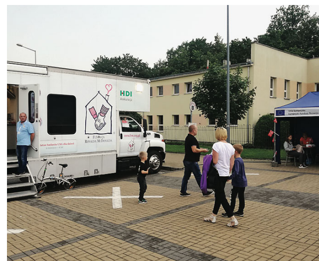
Przez dwa dni przebadano 146 dzieci

Dbając o zdrowie najmłodszych mieszkańców Gminy Goldap 17 i 18 lipca odbyły się bezpłatne badania dzieci w wieku od 9 miesiąca życia do 6 lat. Lekarze w ambulansie Fundacji Ronalda McDonalda, za pomocą aparatu USG, badali tarczycę, węzły chłonne, narządy jamy brzusznej, a u chłopców dodatkowo mosznę. Po zakończeniu badań rodzice otrzymali wynik z opisem oraz porady lekar-