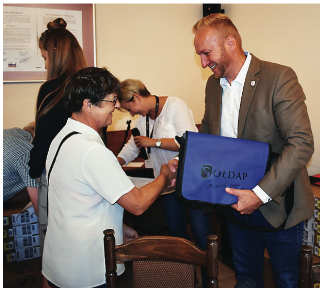
Laptopy będą narzędziem w poprawie elektronicznej komunikacji z Urzędem Miejskim