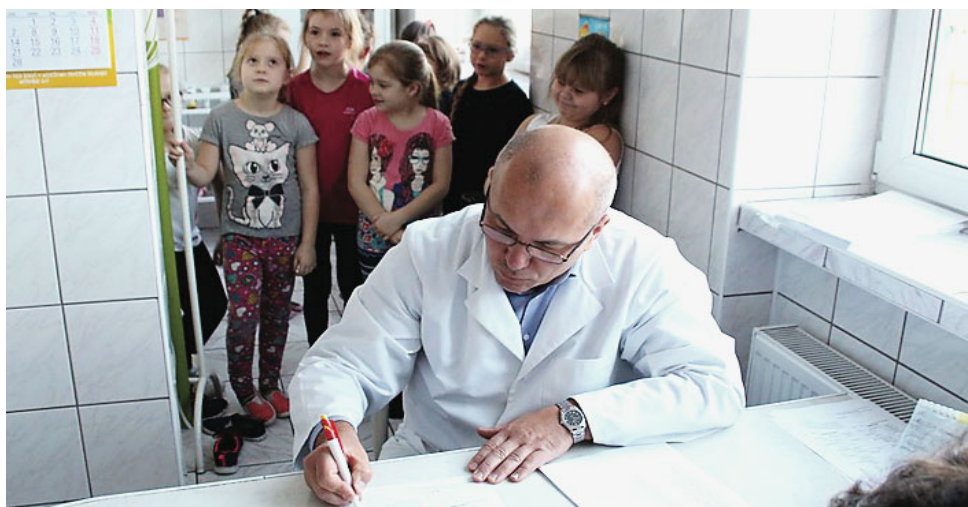
W ramach programu przeprowadzono badania pod kątem wad postawy wśród uczniów szkół podstawowych