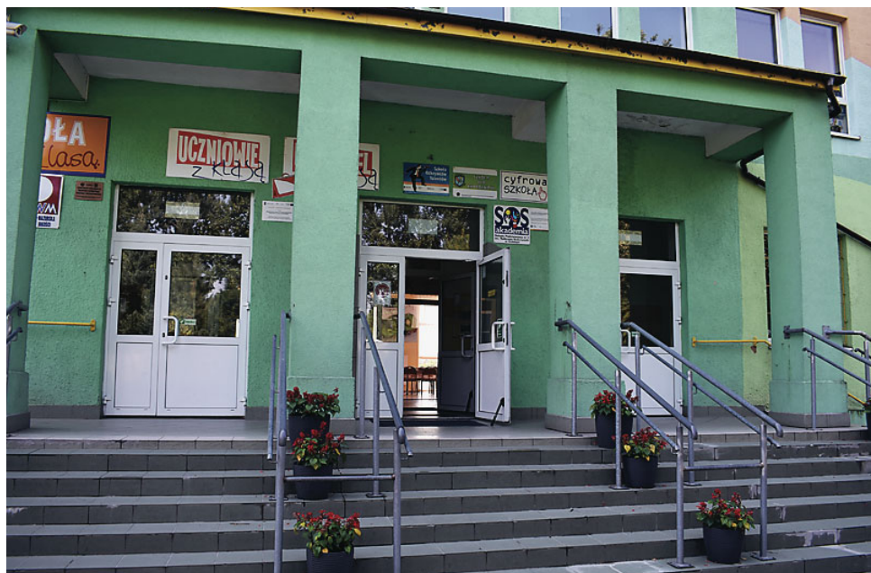
W Szkole Podstawowej nr 3 zostanie zamontowany podjazd dla osób niepełnosprawnych

W Gminie pojawi się też nowy samochód 9-osobowy,