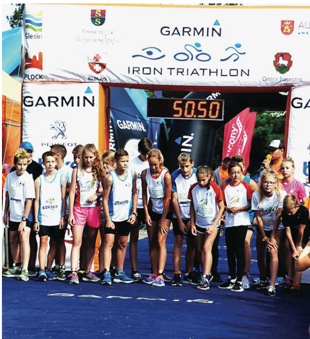
Podczas zawodów odbył się także Garmin Kids