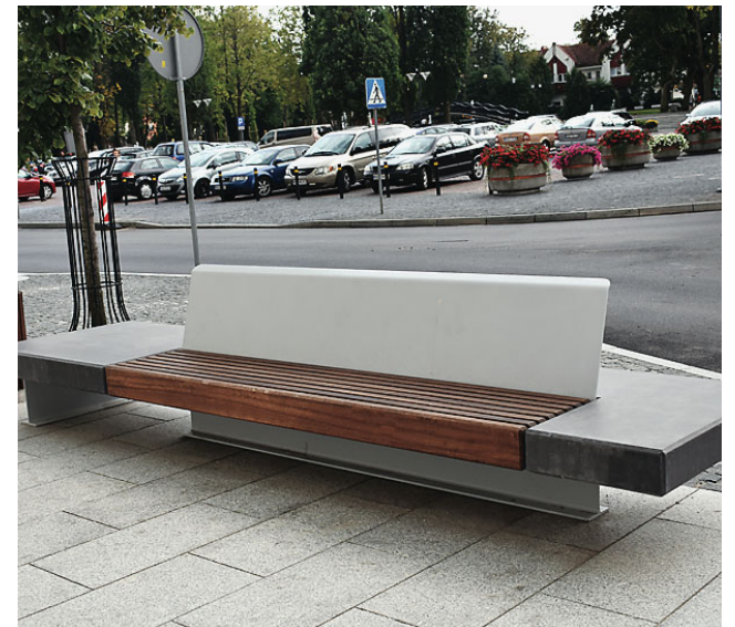
W centrum pojawiły się nowe ławki