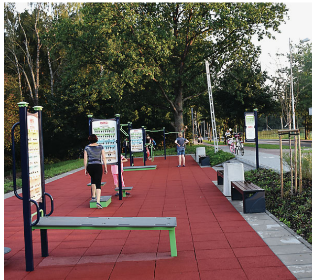
Miejsce do odpoczynku i kinezyterapii na ulicy Stadionowej