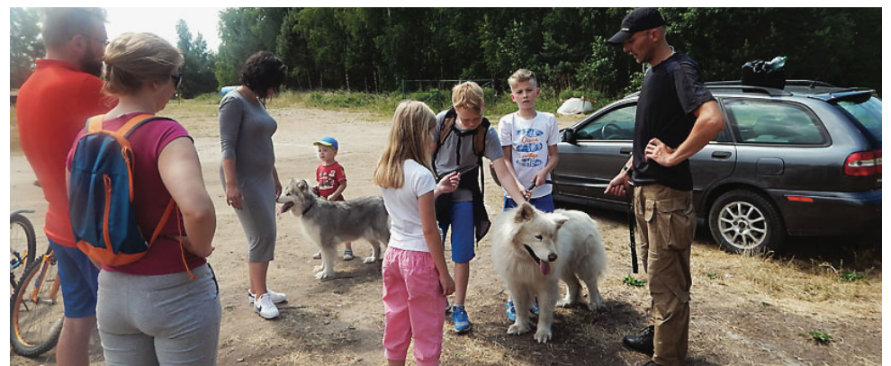
Zajęcia sortowe i spotkania z ciekawymi ludźmi to atrakcje związane z projektem