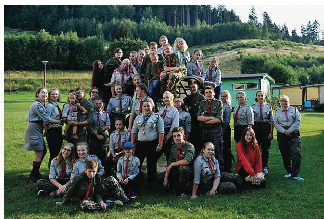
Harcerze z 2 Wielopoziomowej Drużyny Harcerskiej „Aves” w tym roku wybrali się na obóz do Ziemi Kłodzkiej

Piesze wędrówki po górach to jest to, co harcerze lubią najbardziej. Na wyjątkowy obóz, zlokalizowany na drugim krańcu Polski, na Ziemi Kłodzkiej przy granicy z Czechami, wybrali się w dniach 13-23 lipca najstarsi harcerze z 2 Wielopoziomowej Drużyny Harcerskiej „Aves”. Zakwaterowani w Lewinie Kłodzkim, w uroczym Ośrodku Wypoczynkowym „Maria”, podjęli najpierw krótkie wędrówki po Wzgórzach Lewińskich, by następnie wyruszyć dalej. Przeciskali się przez Góry Stołowe w Rezerwacie Błędne Skały oraz zdobyli Szczeliniec, najwyższy szczyt tych gór. Zeszli też głęboko pod ziemię do Kopalni Złota oraz penetrowali zakamarki Jaskini Niedźwiedziej w Maszynie Śnieżnika. Deszcz nie