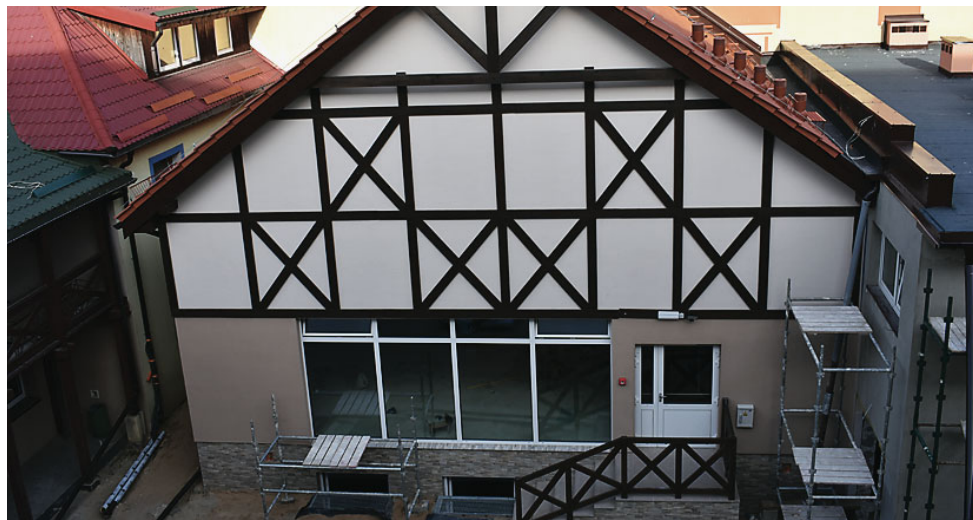
We wschodniej części dzielnicy powstał nowy budynek

Realizacja projektu związanego z Domem Kultury w Goldapi trwa. Powierzchnia użytkowa Domu Kultury w Goldapi powiększy się o prawie 135 m 2 . Realizacja projektu pozwoli na utworzenie studia nagrań i sali prób. Na ich wyposażenie trafi nowoczesny sprzęt umożliwiający nagrywanie i profesjonalną obróbkę dźwięku: fortepian cyfrowy, powermikser, keyboard i wzmacniacz ze słuchawkami. Sala widowiskowa wzbogaci się o reflektory, przetworniki dźwięku, projektor multimedialny, zestaw mikrofonów bezprzewodowych i wytwornicę mgły. Kino Kultura zyska nowe, wygodne fotele, nowe kurtyny oraz elektroniczny system rezerwacji i sprzedaży biletów. Zainstalowany zostanie procesor umożliwiający odtwarzania panoramicznego dźwięku