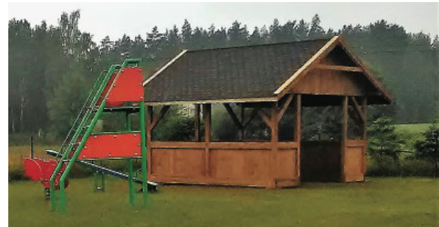
W ramach środków z funduszu sołeckiego w sołectwie Jany została wykonana wiata rekreacyjna

W Rudziach (sołectwo Nasuty) powstał plac zabaw. Teren pod inwestycję nivelowano. Zakupiono i zamontowano zabawki – dwie