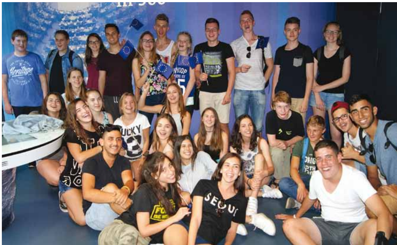
Żegnali się z uśmiechem, niedługo spotkają się znowu

Następnego dnia, zobaczyliśmy w Berlinie wystawę „Topography of terror”. Przewodnik opowiadał wzruszające historie, widzieliśmy zdjęcia z czasów II wojny światowej. W drodze powrotnej z Berlina w mieście Schwerin zjedliśmy lunch w grupach polsko-nie-