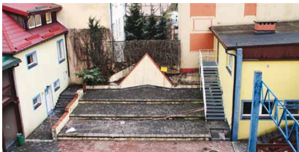
W tym miejscu Dom Kultury powiększy swoją bryłę o dodatkowy, wielofunkcyjny obiekt

Realizacja inwestycji poddyktowana jest coraz bardziej rozwijającą się działalnością Domu Kultury. W istniejącej sali widowiskowo-kinowej odbywa się większa ilość zajęć artystycznych w stosunku