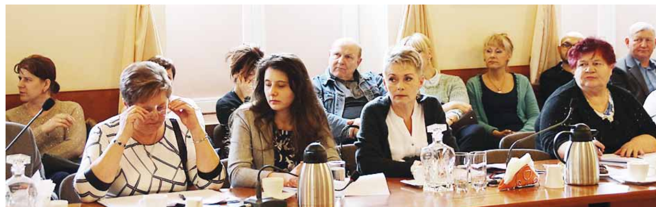
Radni uchwalili w sprawie projektu dostosowania sieci szkół publicznych podstawowych i gimnazjów do nowego ustroju szkolnego w Gminie Gołdap przyjęli na posiedzeniu sesji, 24 lutego.