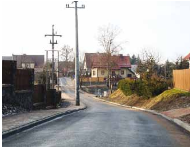
Ulica Stanisława Mikołajczyka.

W Kołkowie i Siedlisku wykonano nawierzchnię żwirową z odwodnieniem i przepustami. Pierwsza inwestycja kosztowała 83,5 tys. zł, a druga- 96,5 tys. zł. Na obie gmina Gołdap uzyskała dofinansowanie w wysoko-