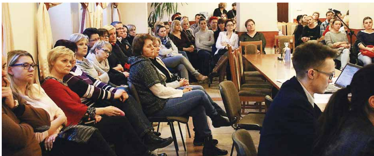
Rodzice uczestniczyli w posiedzeniu komisji oświaty 23 lutego.

Nie, żadne dziecko, które rozpoczęło naukę w szkole podstawowej (dotychczasowe klasy 1-6) nie będzie na siłę przenie-