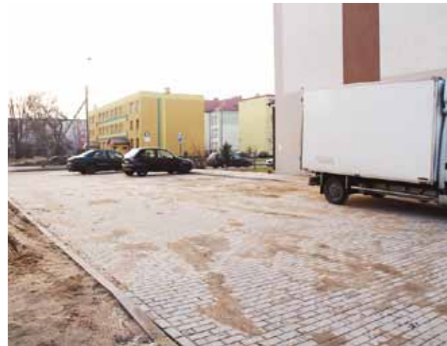
Droga dojazdowa między budynkami nr 17 i 29A przy ulicy Paderewskiego.

Pod koniec grudnia oddano do użytku kolejne dwie